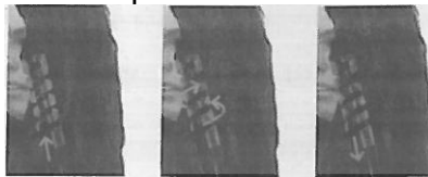
איור 1 איור 2 איור 3

בצעו את הפעולות על כל קווצות השיער עד לקבלת המראה הרצוי. כדי להגביר את מראה התלתלים תוכלו לחזור על התהליך מספר פעמים. אפשרו לשיער להתקרר לפני הצמדתו מחדש למסלסל.